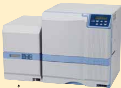
ラミネータユニット「CL-500」