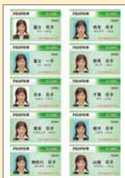
カードイメージ印刷