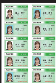
カードイメージ印刷